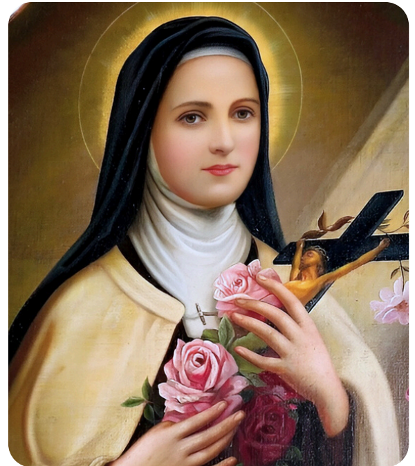
Santa Teresita de Lisieux

Santa Teresita de Lisieux, “la Pequeña Flor”, comprendió profundamente el corazón dulce y humilde de Jesús. Al contemplar cómo ser transformada por el amor de Cristo, reflexionó que “Lo que le agrada [a Jesús] es verme amar mi pequeñez y mi pobreza, es la esperanza ciega que tengo en su misericordia... cuanto más débil se es, sin deseos ni virtudes, más cerca se está de las operaciones de ese Amor consumidor y transformante” (Carta 197 a Sor María del Sagrado Corazón, 17 de septiembre de 1896). Unámonos a Santa Teresita en la oración para que nuestros corazones sean humildes como Jesús.