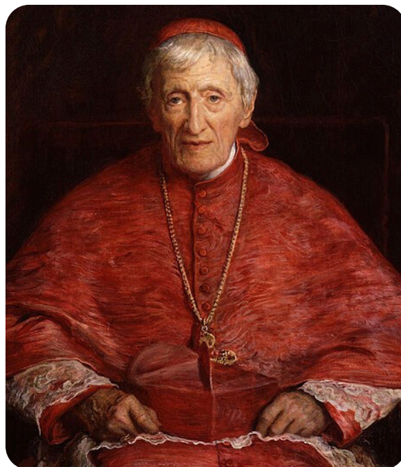
San John Henry Newman por Sir John Everett Millais

San John Henry Newman tomó el lema episcopal Cor ad cor loquitur (“El corazón habla al corazón”), entendiendo que el Señor nos salva hablando a nuestro corazón desde su Sagrado Corazón. Fue en la Sagrada Eucaristía, la mayor forma de alabanza a Dios, donde San John Henry Newman cultivó su encuentro más profundo con el corazón vivo de Jesús. Oremos con San John Henry Newman para que podamos escuchar al Sagrado Corazón que nos habla cuando alabamos y adoramos a Jesús en la Eucaristía.