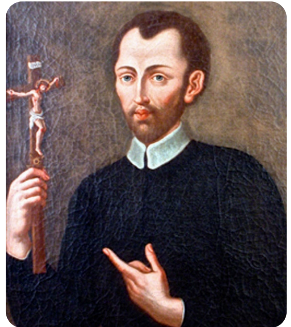
San Alfonso María de Liguorio

Al considerar el Sagrado Corazón de Jesús y el gran amor de Cristo por la humanidad, reflexionamos sobre cómo hemos fallado en alcanzar su amor y la necesidad de expiar nuestros pecados. También aprovechamos este momento para arrepentirnos como nación por los pecados del pasado de nuestro país. Oremos por el perdón y la sanación de los daños causados por los pecados originales de la esclavitud y el racismo de nuestra nación. Un elemento central de la devoción al Sagrado Corazón es la reparación – la práctica de enmendar los errores que hemos cometido, pidiendo a Cristo que perdone nuestros pecados y convierta nuestros corazones para amar como Él ama. Oremos con San Alfonso María de Liguorio, fundador de los Redentoristas, mientras expiamos nuestros pecados y nos consagramos al corazón de Jesús: